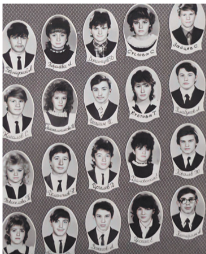
Игорь Игошин во втором ряду в центре

Депутат Государственной Думы Игорь Игошин поделился воспоминаниями о школьных годах