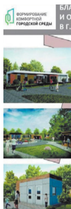
БЛАГОУСТРОЙСТВО ПАРКА КУЛЬТУРЫ И ОТДЫХА ДОБРОСЕЛЬСКИЙ В Г. ВЛАДИМИРЕ

Какими быть скейт-парку, сцене, как обустроить зону торговых ларьков и киосков?