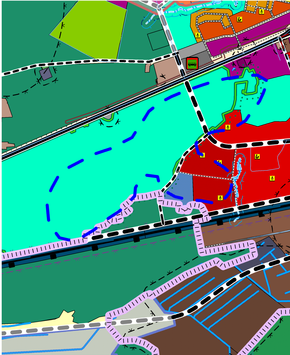
СХЕМА границ территории проектирования

Приложение № 1 к постановлению администрации города Владимира от 15.11.2019 № 3063