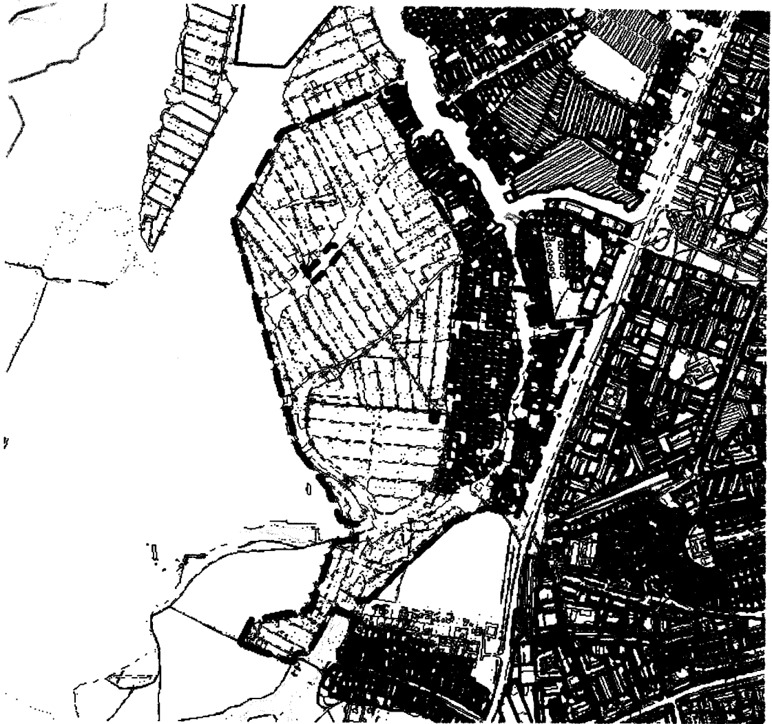
СХЕМА границ территории для проведения общественных обсуждений

Приложение к постановлению главы города от 31.07.2023 № 33