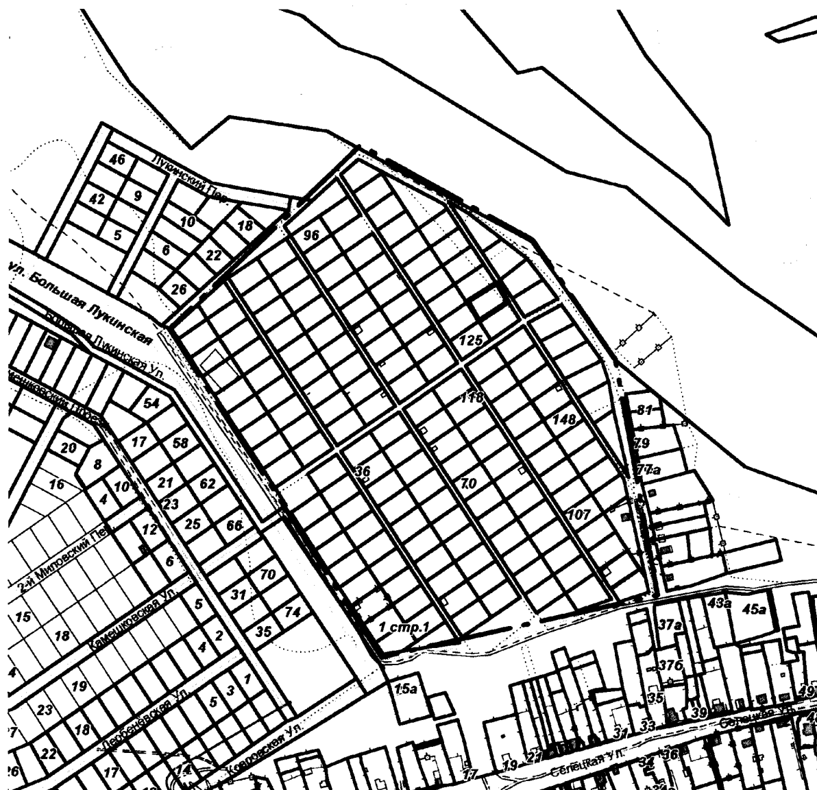
СХЕМА границ территории для проведения общественных обсуждений

Приложение к постановлению главы города от 26.02.2025 № 11