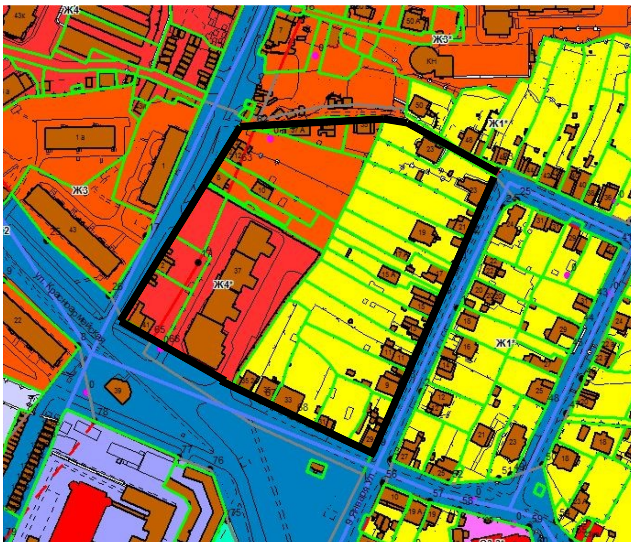
СХЕМА границ территории проектирования

Приложение № 1 к постановлению администрации города Владимира от 10.04.2024 № 782