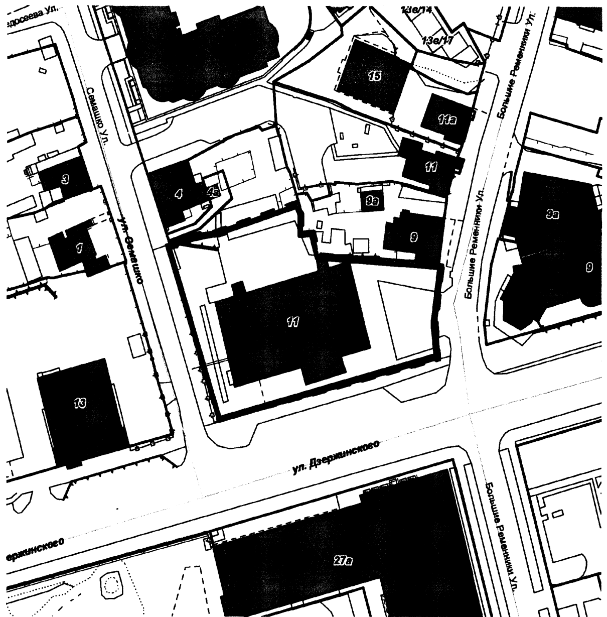
СХЕМА границ территории для проведения общественных обсуждений

Приложение к постановлению главы города от 11.04.2024 № 23