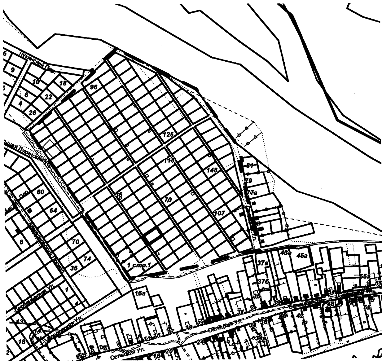
СХЕМА границ территории для проведения общественных обсуждений

Приложение к постановлению главы города от 10.12.2024 № 73