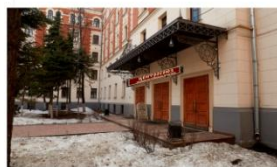
ПАНОРАМНОЕ ФОТО в реальном времени