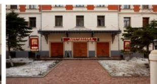
ФРОНТАЛЬНОЕ ПАНОРАМНОЕ ФОТО в реальном времени