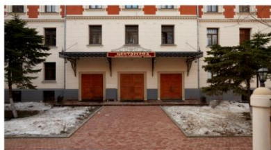
ФОТО ЗДАНИЯ С ГРАФИЧЕСКОЙ ВРИСОВКОЙ ИНФОРМАЦИОННОЙ КОНСТРУКЦИИ